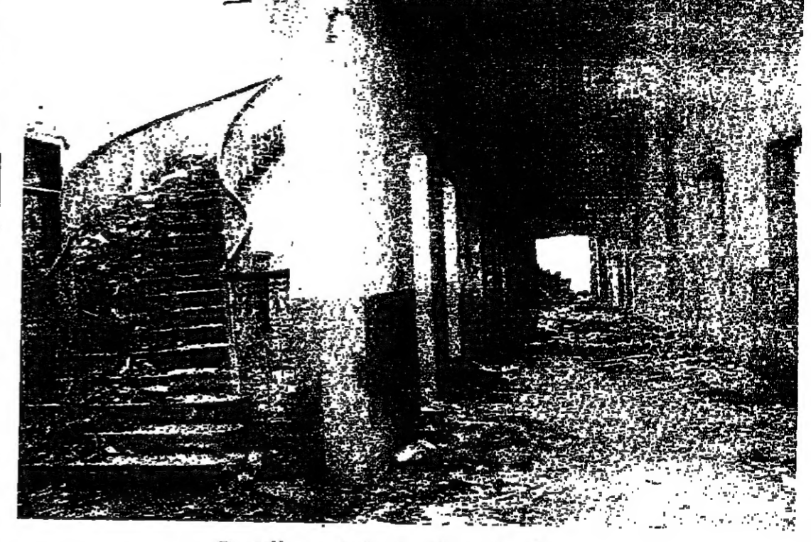
الدرج المنسوك والتمشيد المعمر

من الإدارات الحكومية التي عطلتها الأحداث، الجريدة الرسمية... التي تنشر القوانين والمراسيم الحكومية قوة النفاذ، والصفحة الرسمية ذاتية، وبدونها لا يصبح قانون نافذاً ولا مرسوم صالحاً للتطبيق. على ان الحكومة، وبصورة استثنائية عرضتها للظروف، ابتكرت طريقة جديدة لنشر المراسيم التي تصدرها مؤخراً، وهي نشر هذه القوانين على باب رئاسة الحكومة، واعتبرت هذه المراسيم نافذة من تاريخ تطبيقها على باب رئاسة الحكومة، كما كانت تنشرها في السابق نافذة من تاريخ النشر في الجريدة الرسمية. لكن لتشر على باب رئاسة الحكومة قد يصلح بالنسبة الى المراسيم ذات الطابع الإداري، لكنها لا تصلح للمراسيم التشريعية التي تتضمن قوانين وعقوبات، كالمرسوم الذي صدر بصدد قرش الرقابة على الصحف. وتعليقاً، قال احد القضاة، انني كقاضى لم اتفخ هذا المرسوم بعد، وإذا صدق ان احيل امامي احد الصحفيين، هل ادعه في مكنتي واذهب الى السراي الجديدة، لآقرأ نص القانون الذي سحلكه على اساسه؟